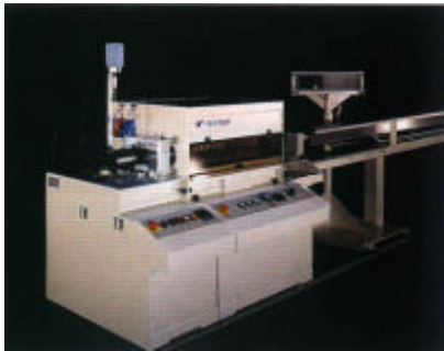
管材牵引及自动切割系统