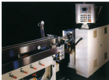
“紧凑”型挤出机设计及定径槽