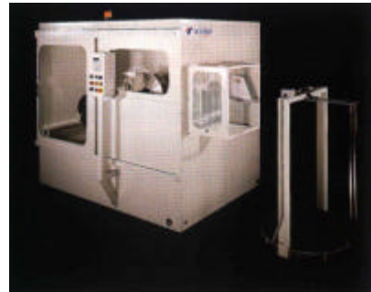
自动卷绕及张力控制系统